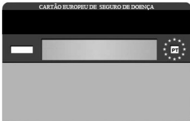
Verso do cartão.