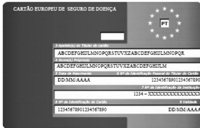
Frente do cartão.